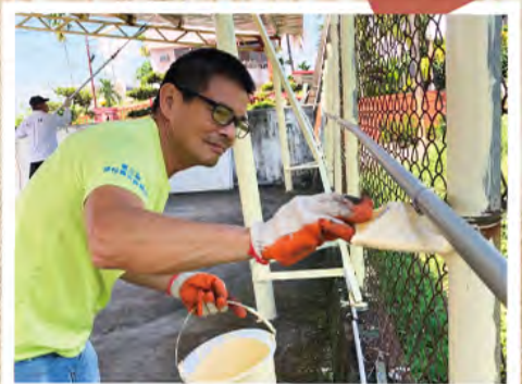
帶弟兄修繕家園周圍 欄杆刷油漆

在萬榮記憶中，於旗輔所時期，有位較特殊的弟兄。「當他情緒要壓抑不住時，他會來告訴我，他想要紓解一下他的情緒，比如到適應室去哭泣一下，還是到後山拿棍子打樹發洩一下。而近來在伯特利家園的個案就不一樣了。弟兄間開玩笑是常有的，有一次可能玩過火，A弟兄拿起木榔頭就往B弟兄的頭打了一下，後來A弟兄情況越來越糟，竟到廚房拿菜刀剝自己的小指，剝了後到前面跟同工說他小指斷了。