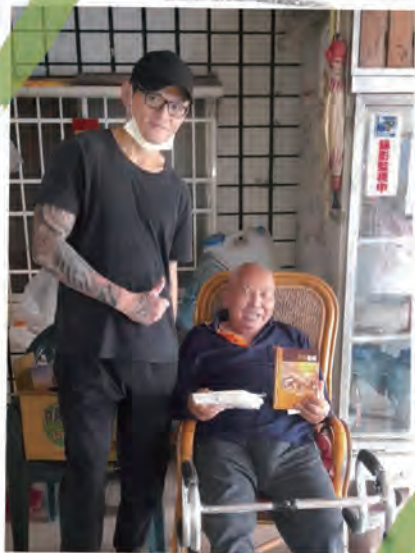
義源送餐關懷獨居老人