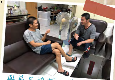
與弟兄協談, 陪伴關懷