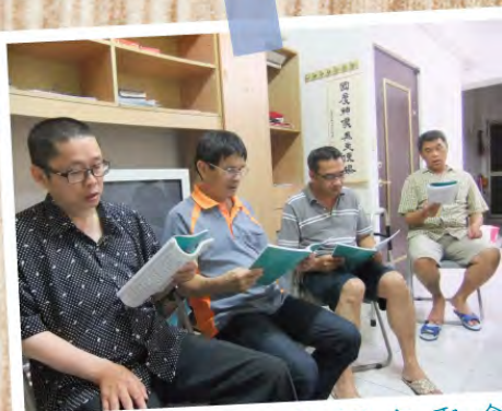
102年5月沐恩歸家聚會