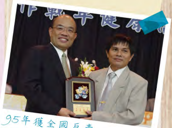
95年獲全國反毒 有功人士殊榮

上期家訊(106期)「神國接線生」之人物專訪，文中p11誤植一名稱為“天使敬拜使徒中心” 一正確名為“天堂敬拜使徒中心”，特此更正。