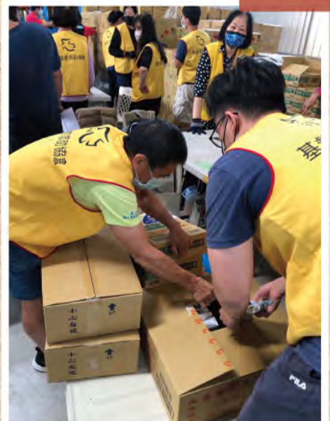
帶全村弟兄協助1919 救助協會搬運物資