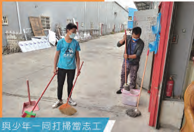
與少年一同打掃當志工