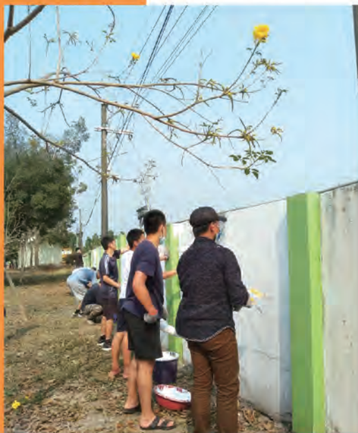
帶少年至新生國小油漆圍牆，敦親睦鄰