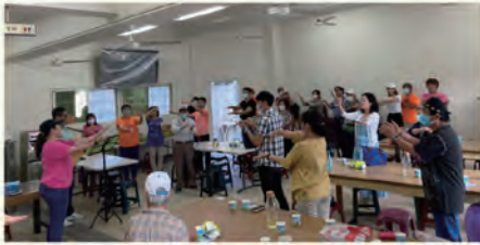
▲ 至旗津戶外旅遊，敬拜，遊戲