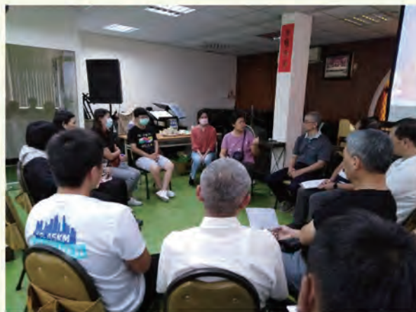
▲ 2020. 07. 04 第一次家屬團契聚會

每逢聚會當週，我就開始緊張且焦慮。「這週誰要出席？」我不斷要求夥伴們提供出席名單，感覺就像有業績壓力似的，擔心如果沒人來怎麼辦？每一次聚會出席的家屬，臉上從沒有一絲由心而發的喜悅，直到在聚會中常分享到淚流滿面。他們只能在這短暫聚會中抒發內心無奈及無助。聚會後擦乾淚水，拖著疲憊的身軀回到那本該充滿喜悅、盼望與幸福的家中。