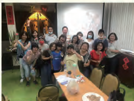
◀ 家屬團契慶祝母親節

一次主日中聽到「浪子回頭」的故事，就常用此故事來安慰家屬。誰能體會成癮者家屬們的感受，正如故事中浪子的父親般。面對自私自利、不願受約束、反覆用藥等問題的成癮者，我們要如何陪伴這群家屬，讓他們不失去信心？有時我自己也會信心軟弱，就想到經上說：「應當一無掛慮，只要凡事藉著禱告、祈求和感謝，將你們所要的告訴神，神所賜人意外的平安，必在基督耶穌裡保守你們的心懷意念。」陪伴過程中我常跟自己如此說，也如此鼓勵家屬：「不要被成癮者綁架，禱告祈求將所想的都告訴神，相信神定垂聽我們每一個禱告及呼求。」