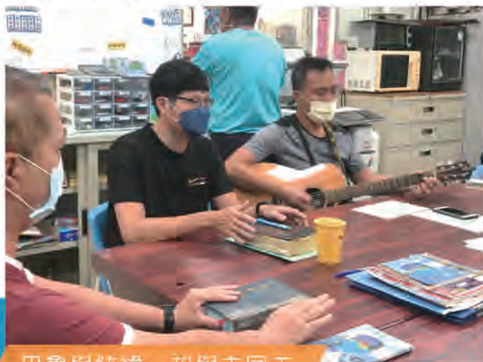
巴魯與絃緯一起與主同工

巴魯指出：「學樂器對戒癮者而言，若單純學音樂方面，確實沒多大助益；但如果能從音樂接觸詩歌，學會唱詩讚美敬拜神，那祂帶來的幫助就不是我所能想像的。」除了教吉他，他在與學生聊天中也會分享自己的過去。大部分以鼓勵為出發，至於信仰也會先了解對方的需要而分享自己的信仰生活。比如自己處理事物的態度與方式等。他自謙其實並不善於交際聊天，所以抱著教吉他，若能讓學生們找回自信便值得！