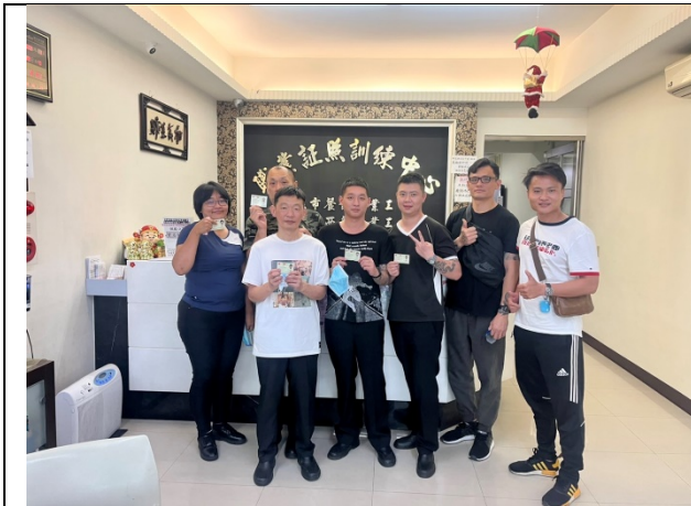
學員與生輔員考取中餐丙級證照