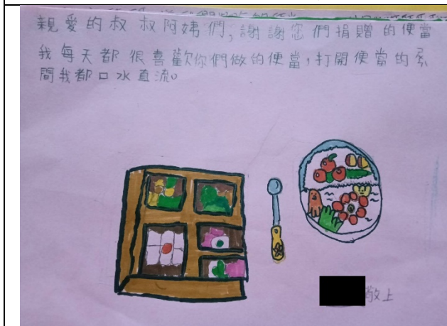
課輔班孩童回饋卡片