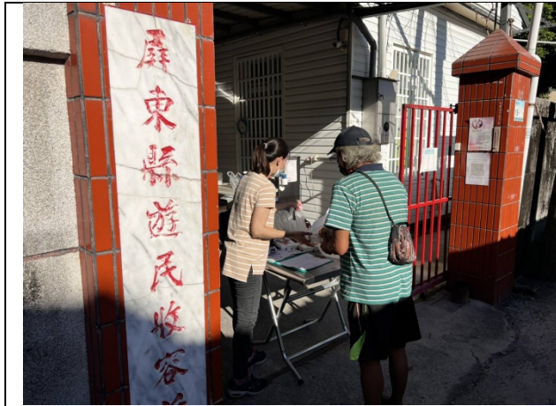
送餐服務弱勢族群