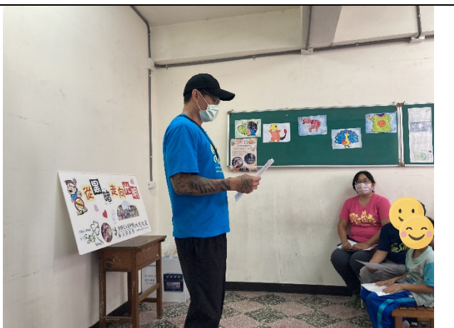
至課輔班反毒生命教育