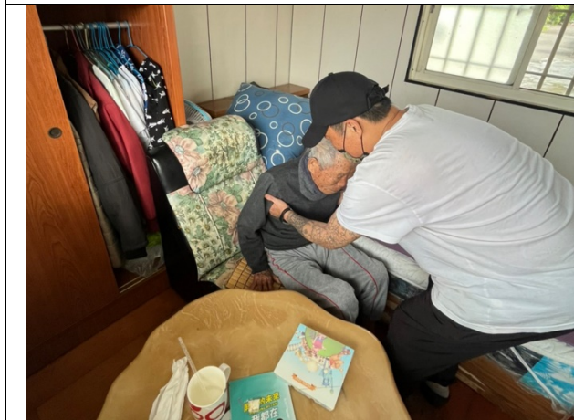
送餐服務弱勢族群