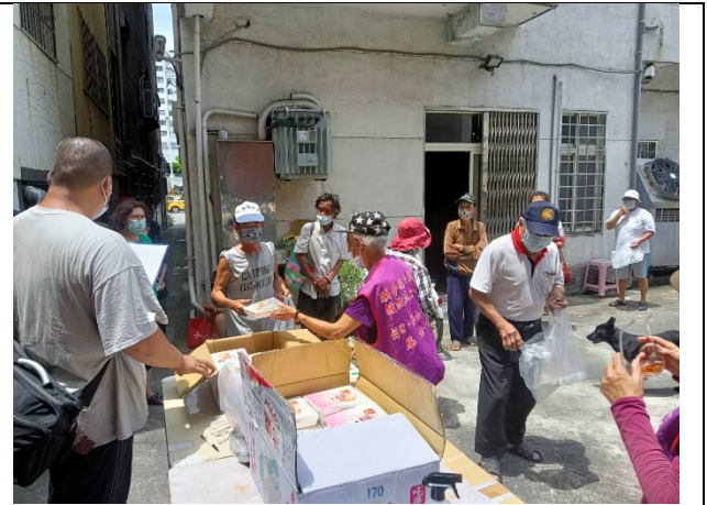
送餐服務弱勢族群