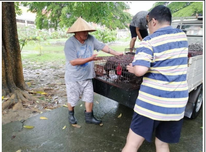
工作治療-農務技能