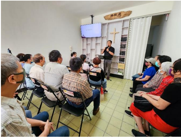
安歇處成立感恩禮拜