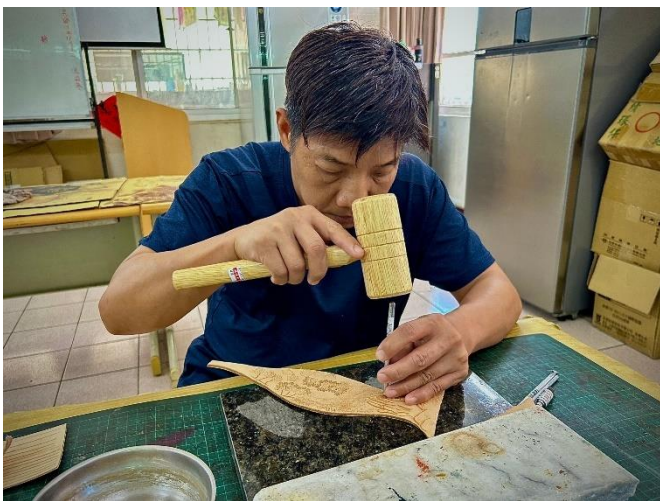
工作治療-皮雕製作