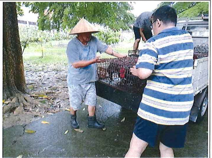
工作治療-農務技能