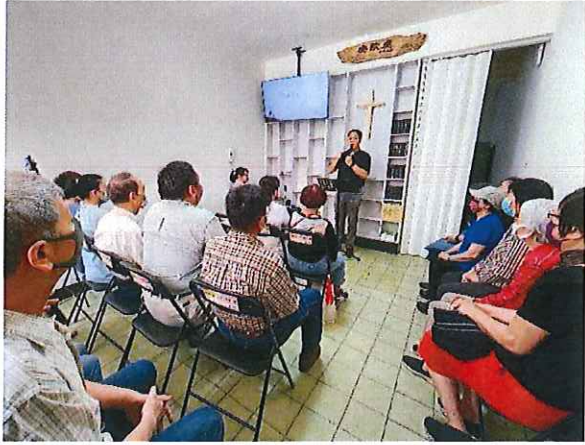
安歇處成立感恩禮拜