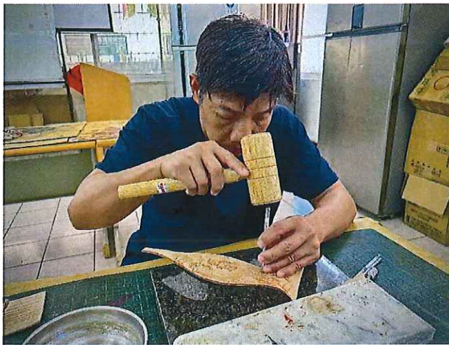
工作治療-皮雕製作