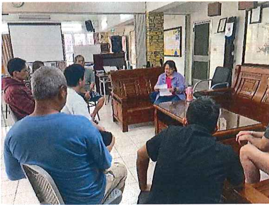
身體恢復-保健座談會