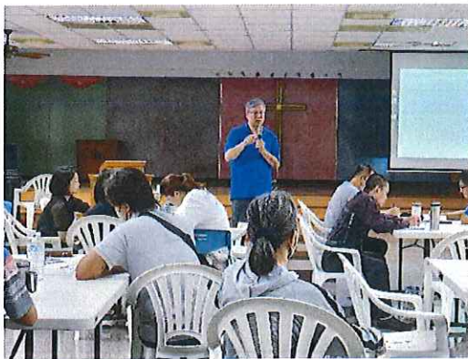
靈性課程-學員分享討論